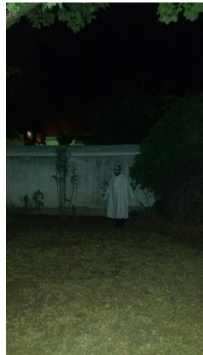
ABOVE: Photo of a "ghost" who was specially called for the Evening Stroll

The Stellenbosch Museum entered into a collaboration agreement with the Pniel Museum in 2017 and it was a privilege for the Board of Trustees and staff of the Stellenbosch Museum to participate in this event.