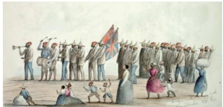
VRYHEIDSDAG, 1 DESEMBER 1838. Bevryde slawe ruk op om hul Vryheid te vier