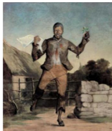
'n Slaaf juig oor sy vryheid, soos deur F.T. l'Ons geteken (Kaape Argief Bewaarplek)